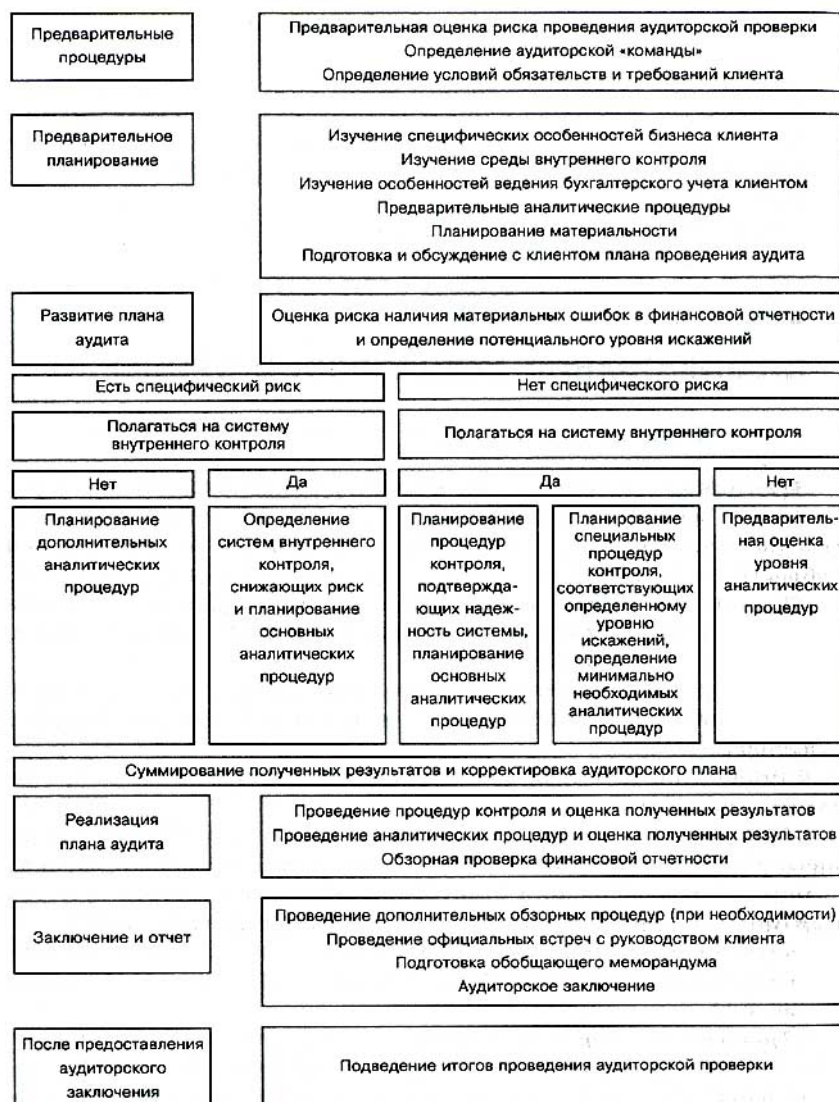
Рис. 6.1. Общая схема проведения аудиторской проверки