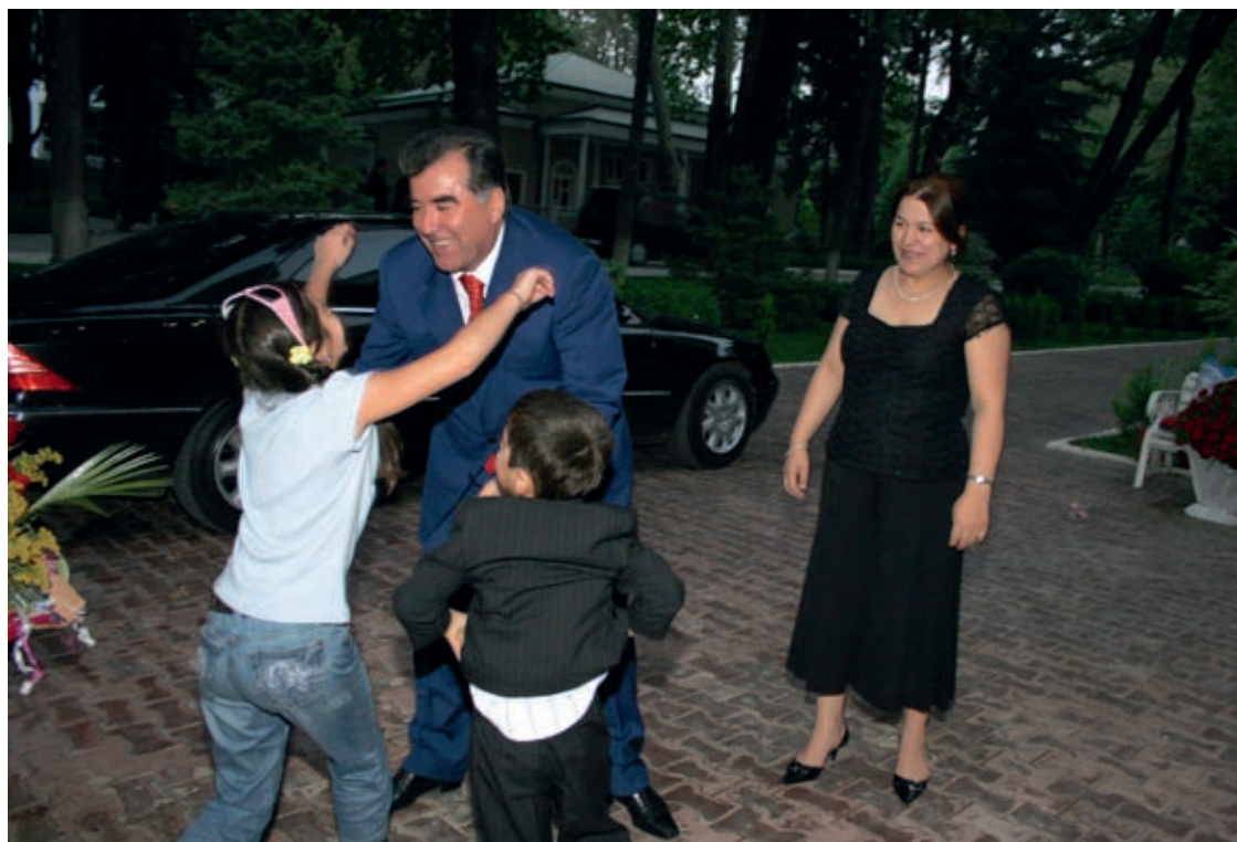
Emomali Rahmon with his daughter Ozoda and grandchildren