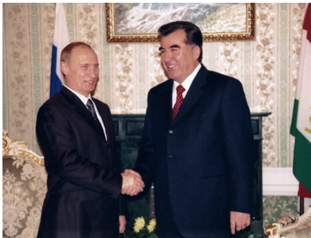
Emomali Rahmon with the President of the Russian Federation Vladimir Putin October 4, 2004, Dushanbe