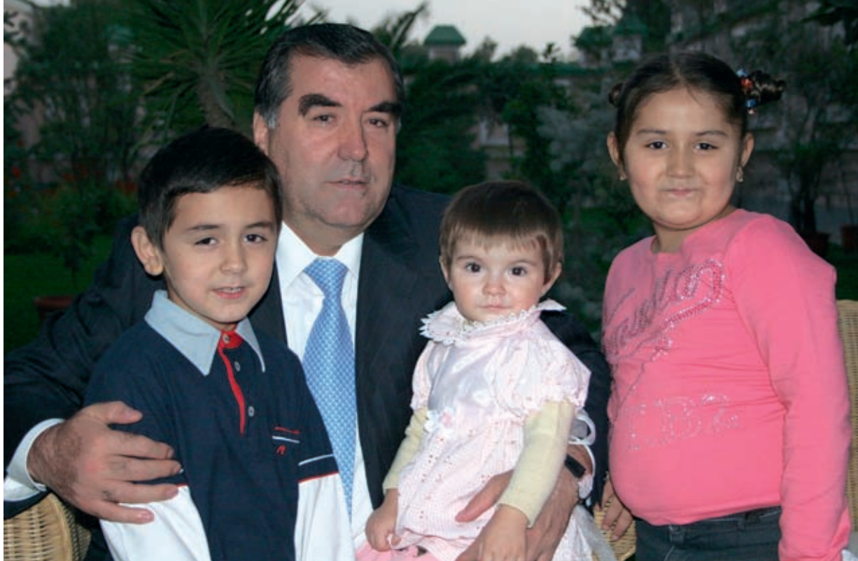
Emomali Rahmon with his children and granddaughter