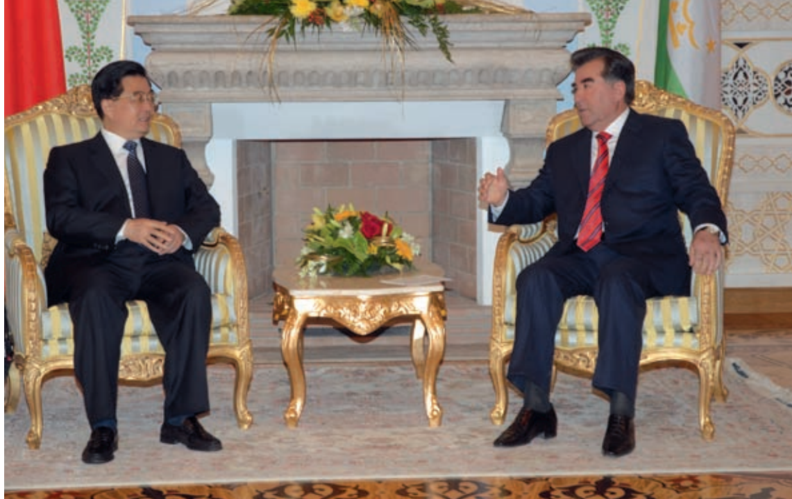
Emomali Rahmon with the President of the People's Republic of China Hu Jintao August 27, 2008, Dushanbe