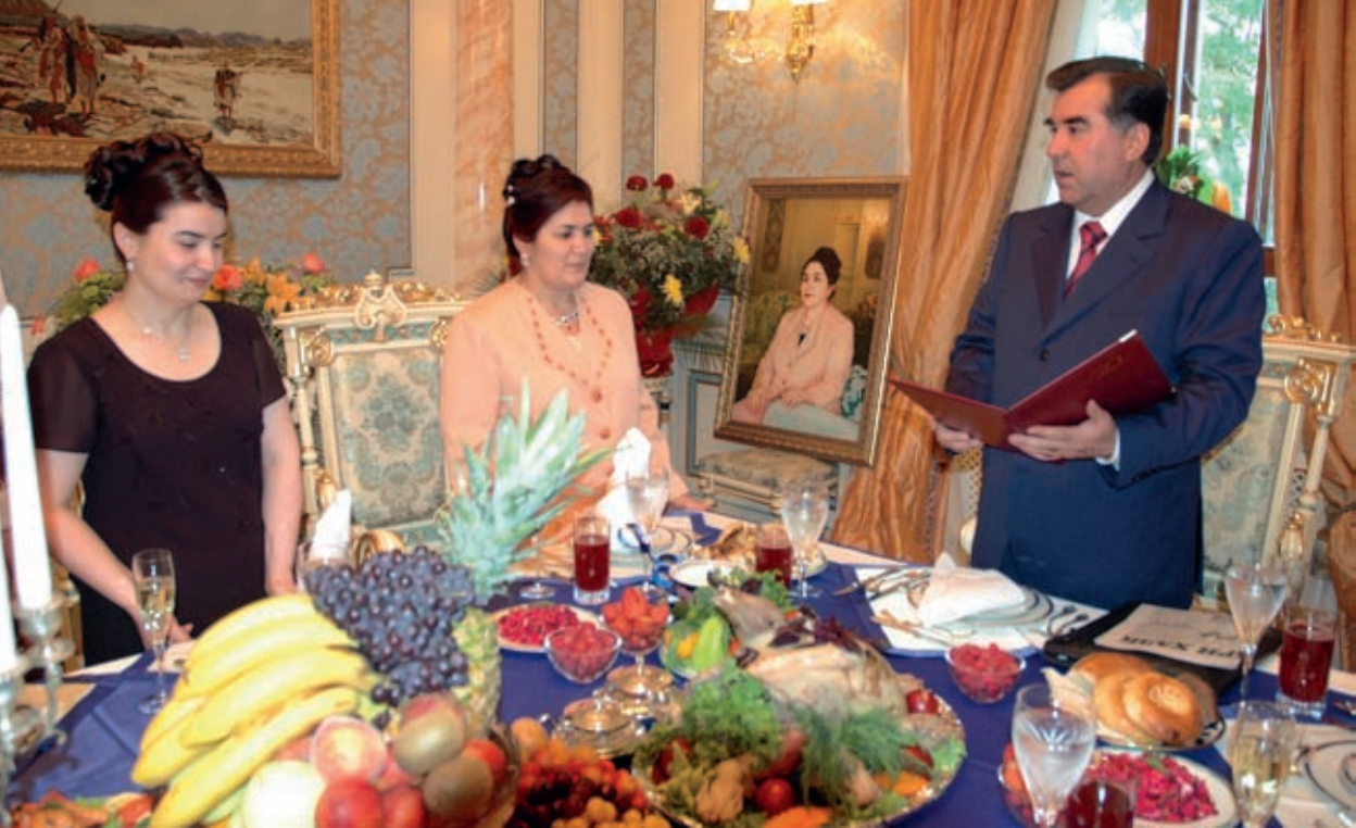
Emomali Rahmon congratulates his spouse on the occasion of her birthday