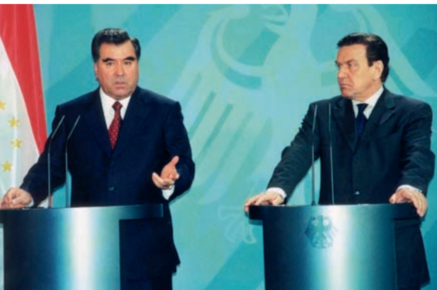
Emomali Rahmon with the Federal Chancellor of Germany Gerhard Shreder March 27, 2003, Berlin