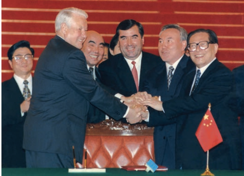
Emomali Rahmon among the heads of states of the Shanghai Cooperation Organization