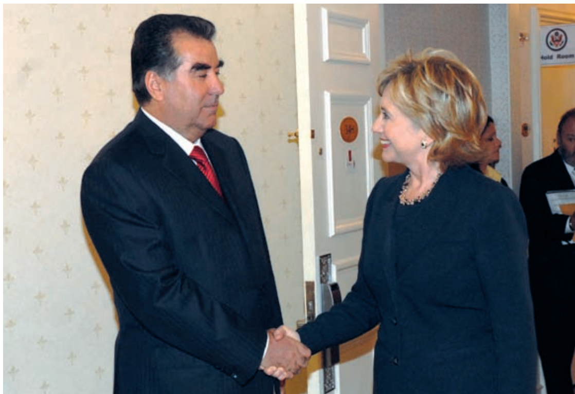
Emomali Rahmon and the Secretary of State of the United States of America Hillary Clinton September 25, 2009, New York