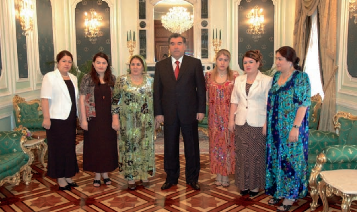
Emomali Rahmon in the bosom of his children and relatives