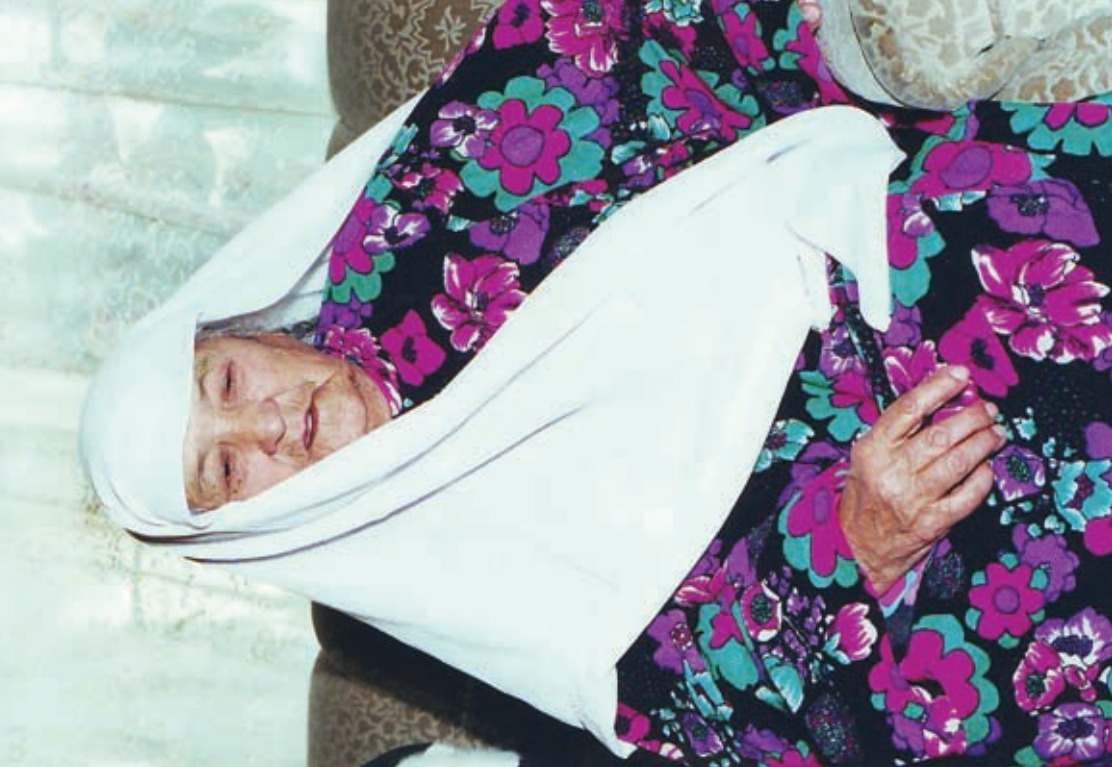
Emomali Rahmon's mother Mairam Ziyo