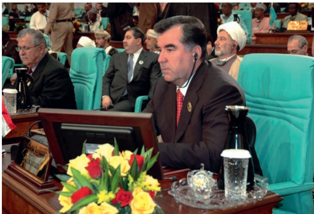
Emomali Rahmon at the Organization of the Islamic Conference Summit December 7, 2005, Mecca