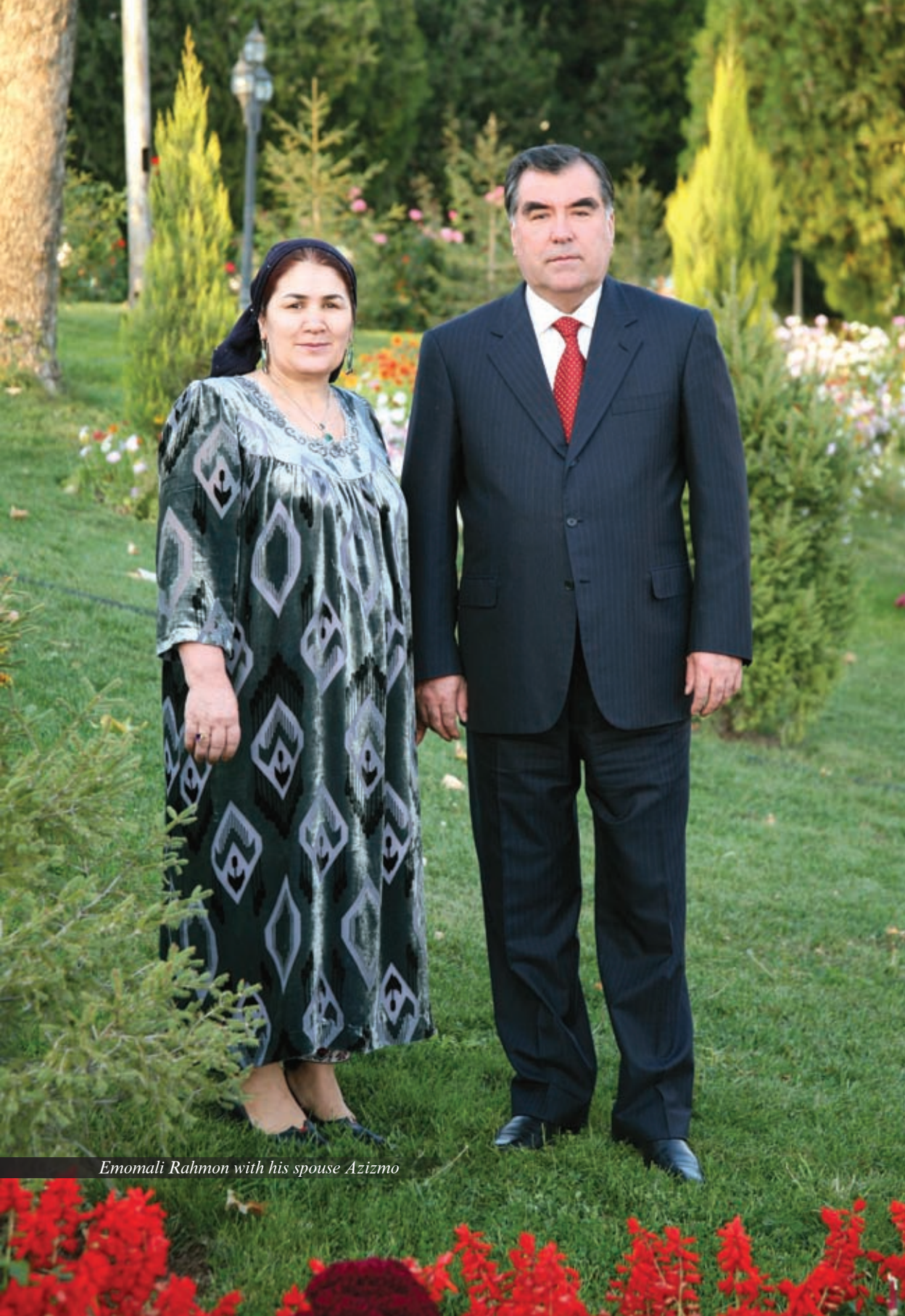
Emomali Rahmon with his spouse Azizmo