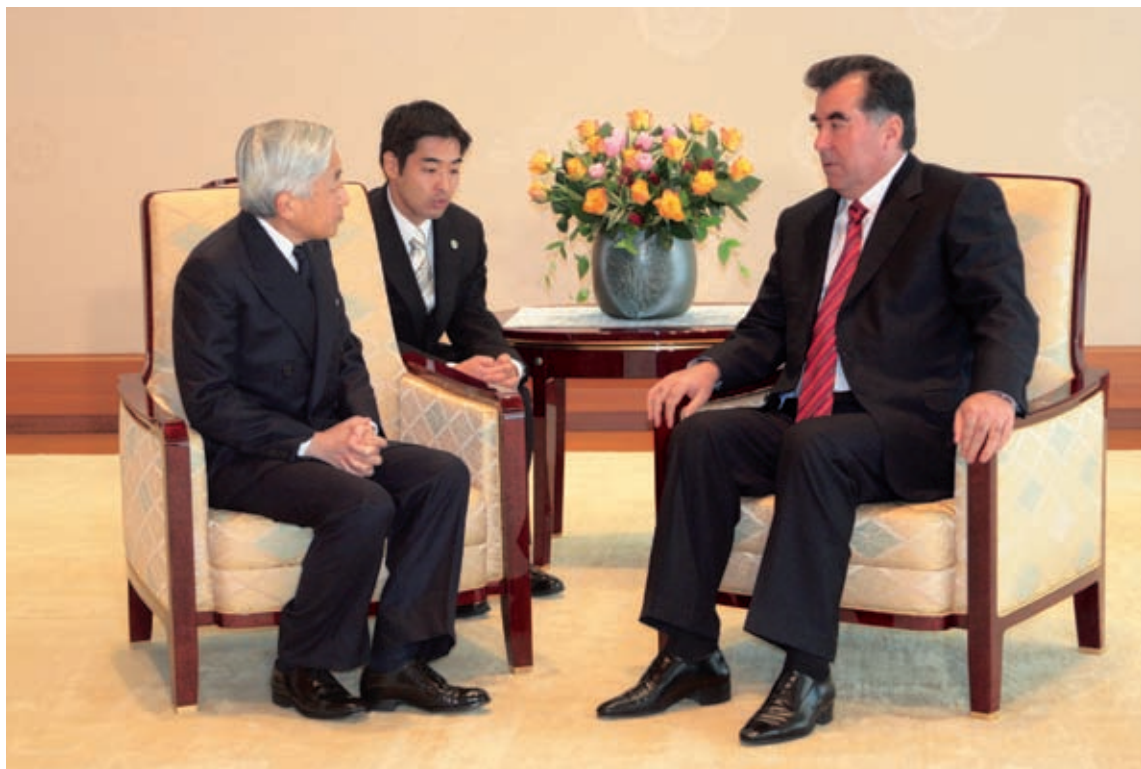
Meeting of Emomali Rahmon with the Emperor of Japan Akihito December 3, 2007, Tokyo