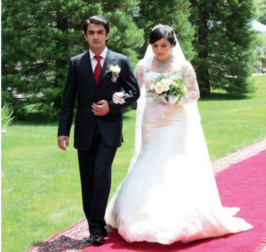
Рустам Эмомали с супругой Фатимой