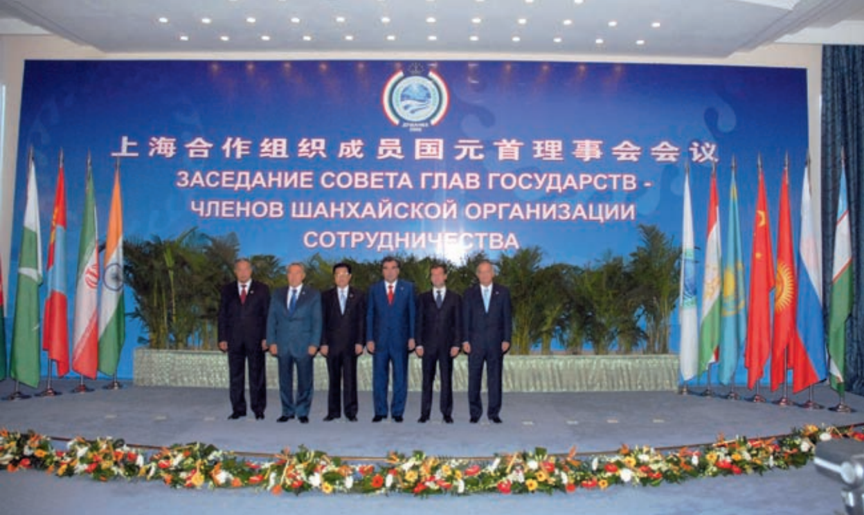
Shanghai Cooperation Organization Summit in Dushanbe