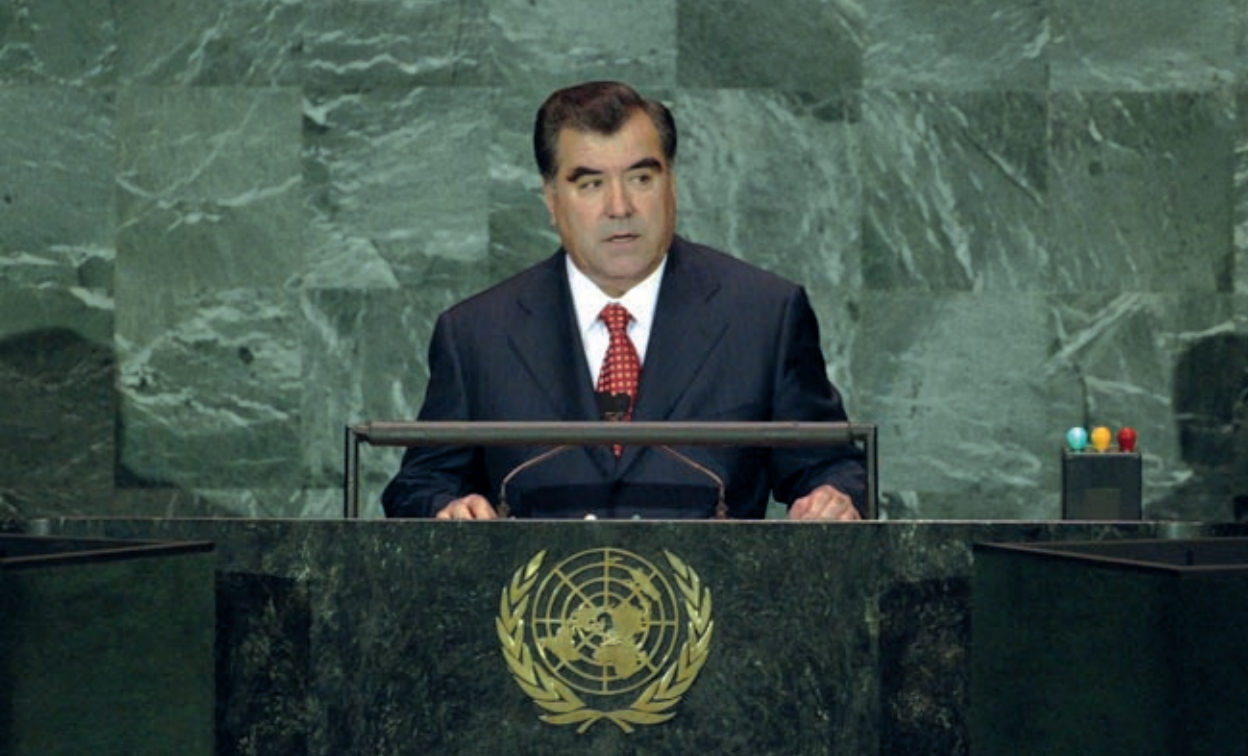
Address by the President of the Republic of Tajikistan Emomali Rahmon from the high tribune of the 60th session of the United Nations General Assembly September 19, 2005, New York