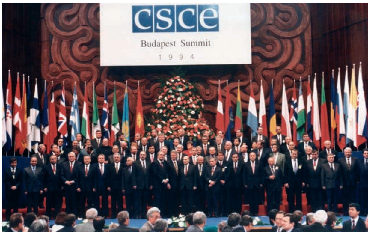
Emomali Rahmon at the summits of the Organization for Security and Cooperation in Europe December 5, 1994, Budapest