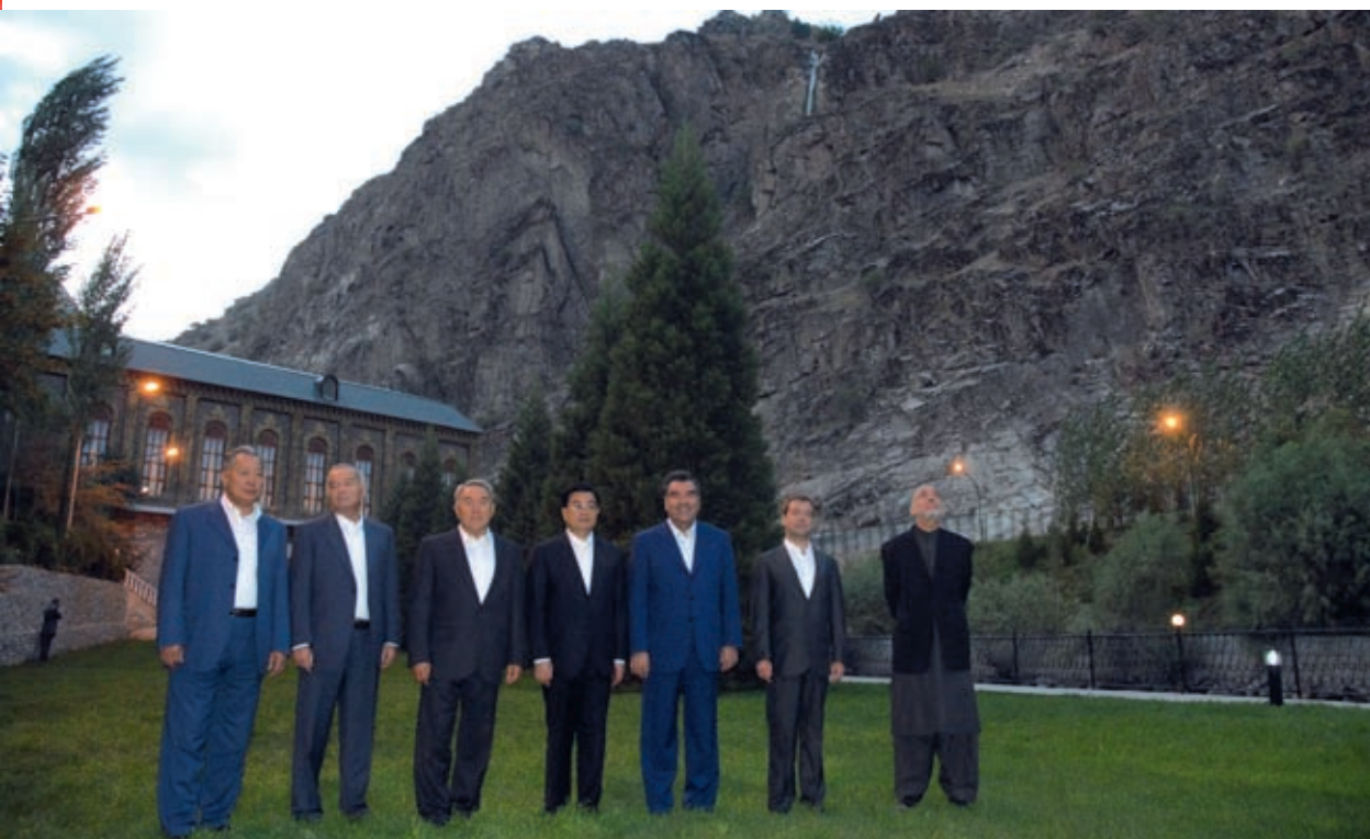
Emomali Rahmon among the heads of states of Shanghai Cooperation Organization in Varzob residence August 30, 2008, Varzo