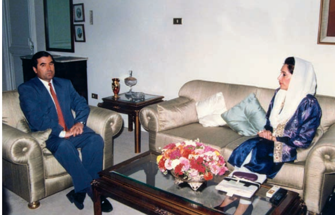
Emomali Rahmon meets the President of the Islamic Republic of Pakistan Farooq Ahmad Khan Leghari and the Prime Minister of the Islamic Republic of Pakistan Benazir Bhutto March 29, 1994, Islamabad