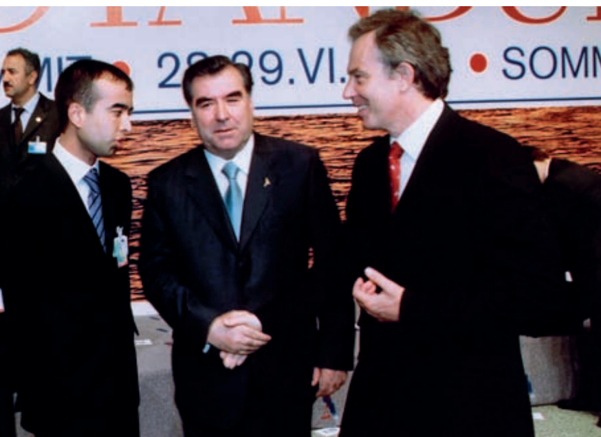
Emomali Rahmon with the Prime Minister of Great Britain Tony Blair June 29, 2004, Istanbul