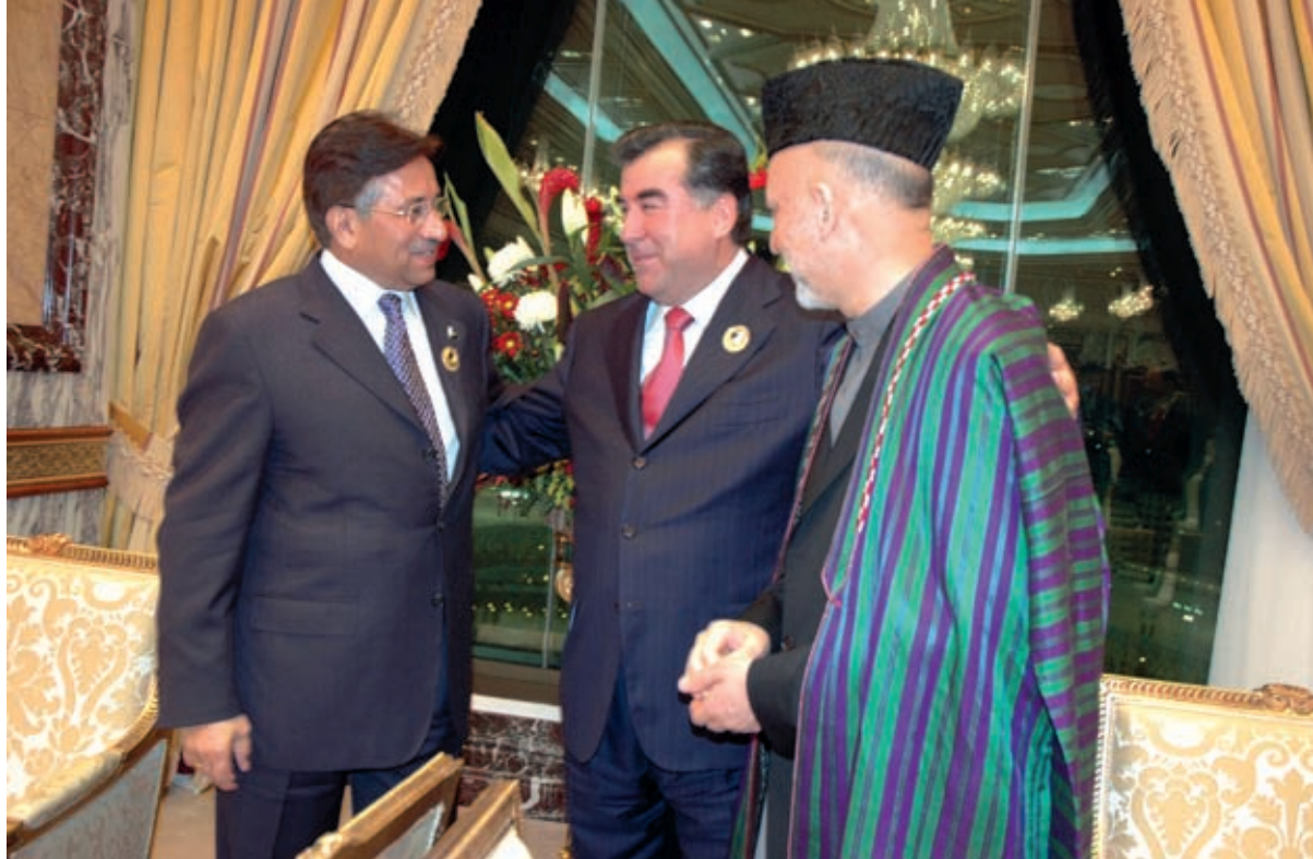
Trilateral meeting of the Presidents of the Republic of Tajikistan, the Islamic Republic of Afghanistan and the Islamic Republic of Pakistan December 7, 2005, Mecca

Presidents of the Republic of Tajikistan, - Emomali Rahmon, the Islamic Republic of Afghanistan, - Hamid Karzai, the Islamic Republic of Pakistan, - Asif Ali Zardari and the Russian Federation, - Dmitry Medvedev July 30, 2009, Dushanbe