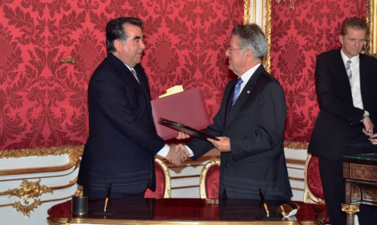
Meeting of the President of the Republic of Tajikistan Emomali Rahmon with the President of the Republic of Austria Heinz Fischer June 7, 2011, Vienna