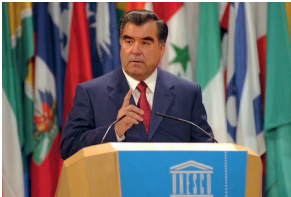
Emomali Rahmon at UNESCO October 10, 2005, France