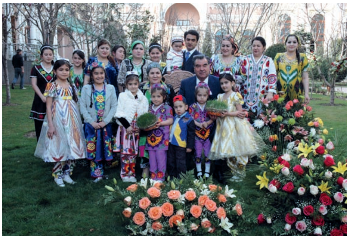
Emomali Rahmon with his children and grandchildren