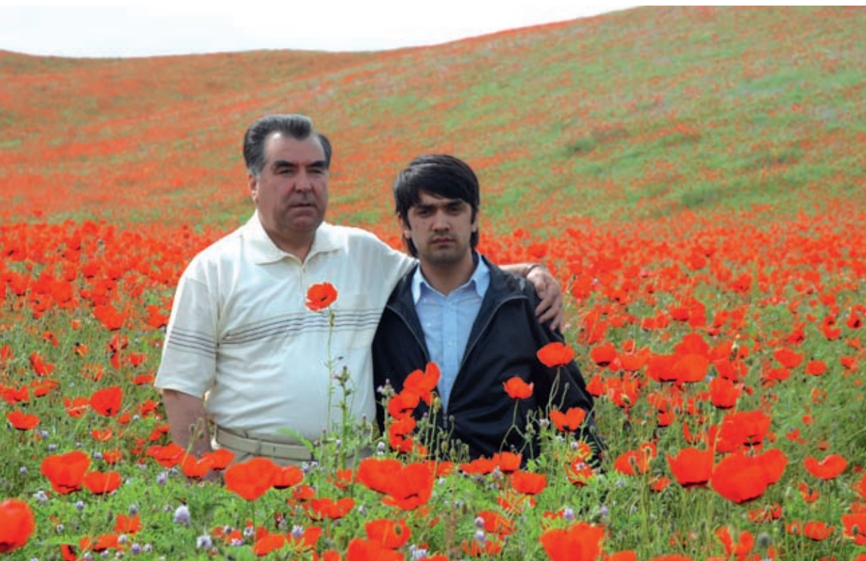
Emomali Rahmon with his son Rustam Emomali