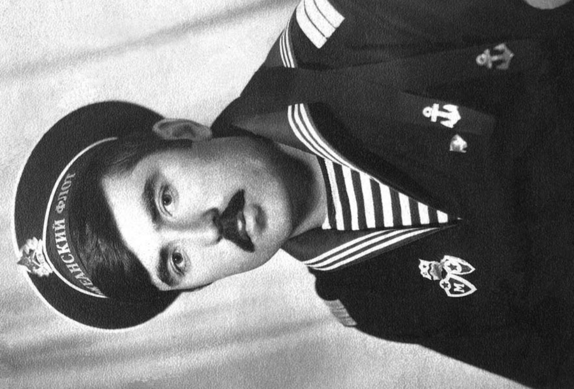
Emomali Rahmon in military service