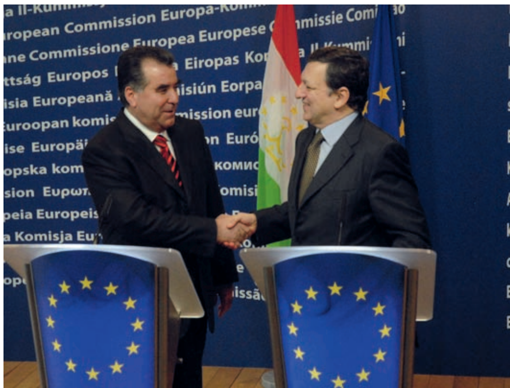
Emomali Rahmon with the President of the European Commission Jose Manuel Barroso February 10, 2009, Brussels