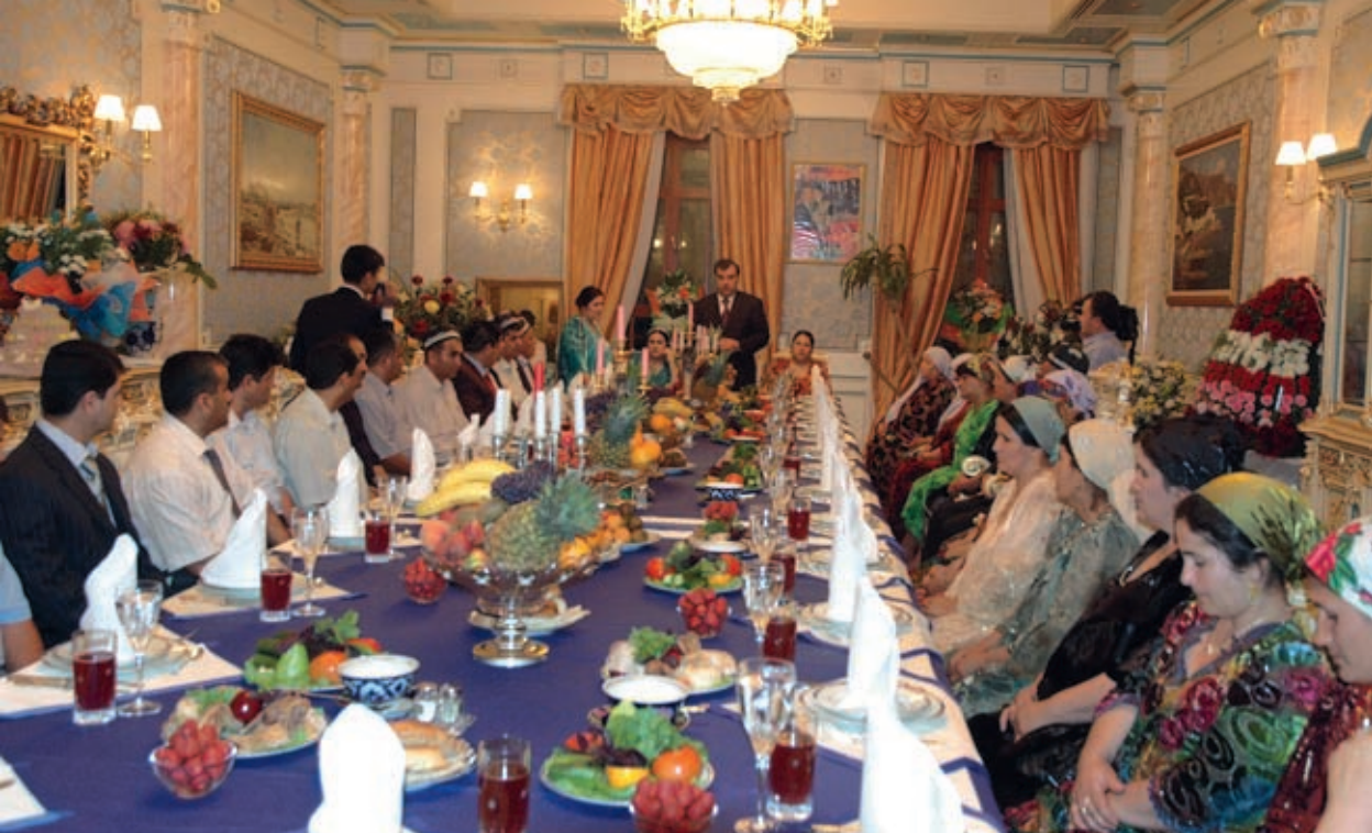
Festive dastarkhan of Emomali Rahmon's family