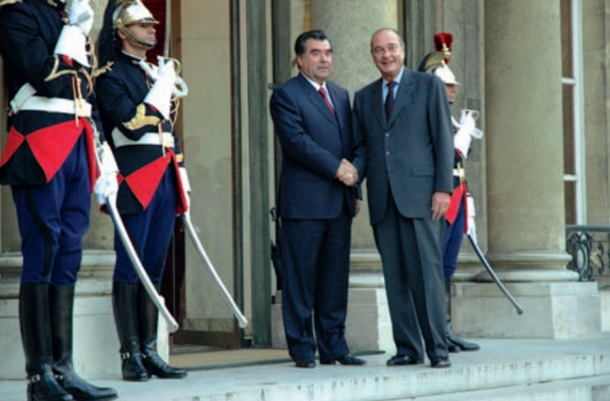
Emomali Rahmon with the President of France Jacques Chirac October 11, 2005, Paris