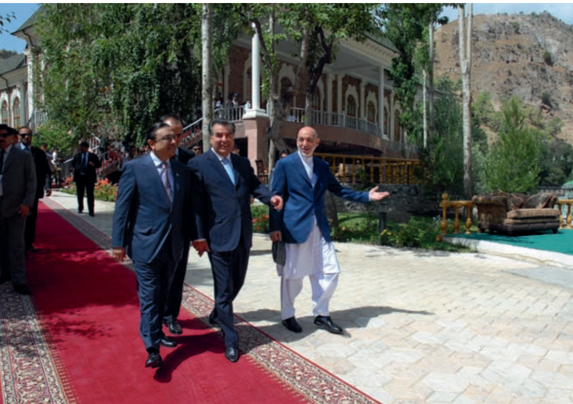
Trilateral meeting of the Presidents of the Republic of Tajikistan, the Islamic Republic of Afghanistan and the Islamic Republic of Pakistan July 30, 2009, Varzob