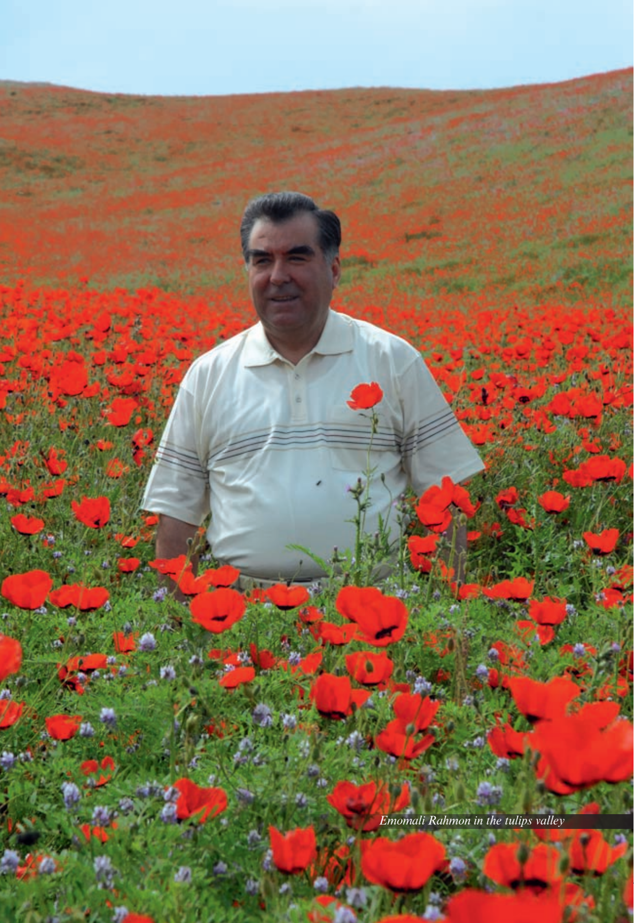
Emomali Rahmon in the tulips valley