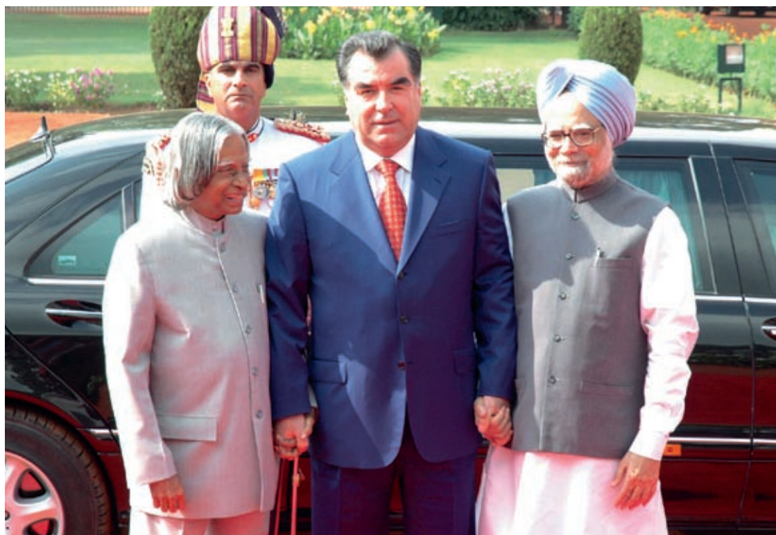
President of the Republic of Tajikistan Emomali Rahmon with the Prime Minister of India Manmohan Singh August 26, 2006, Delhi