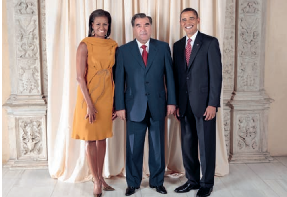
Emomali Rahmon with the President of the United States of America Barack Obama and his spouse September 25, 2009, New York