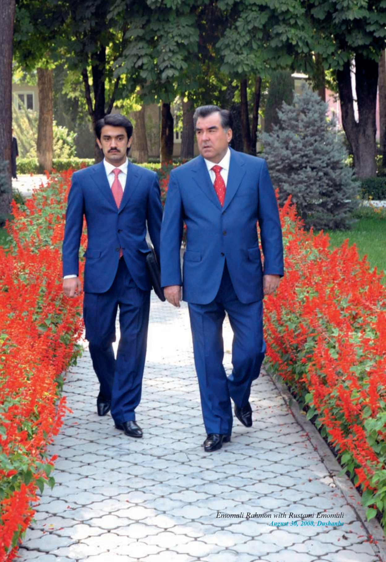
Emomali Rahmon with Rustami Emomali August 30, 2008, Dushanbe