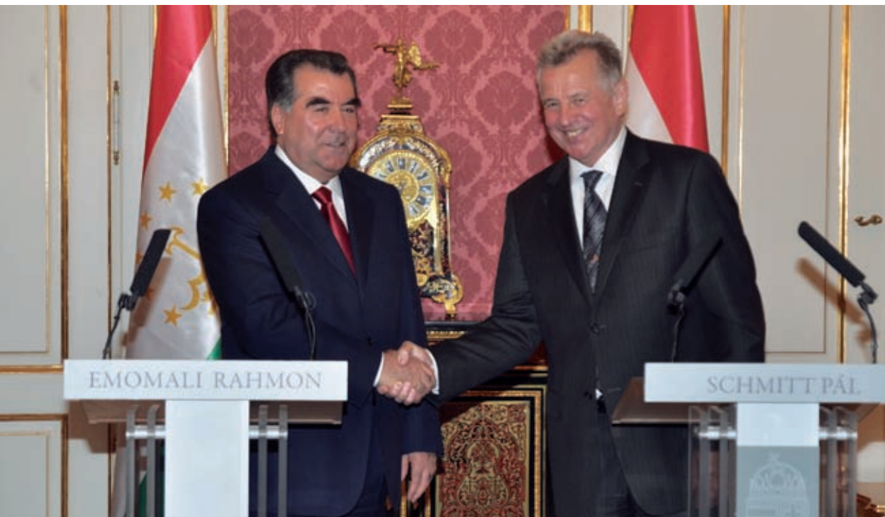
Official visit of the President of the Republic of Tajikistan Emomali Rahmon to Hungary June 10, 2011, Budapest