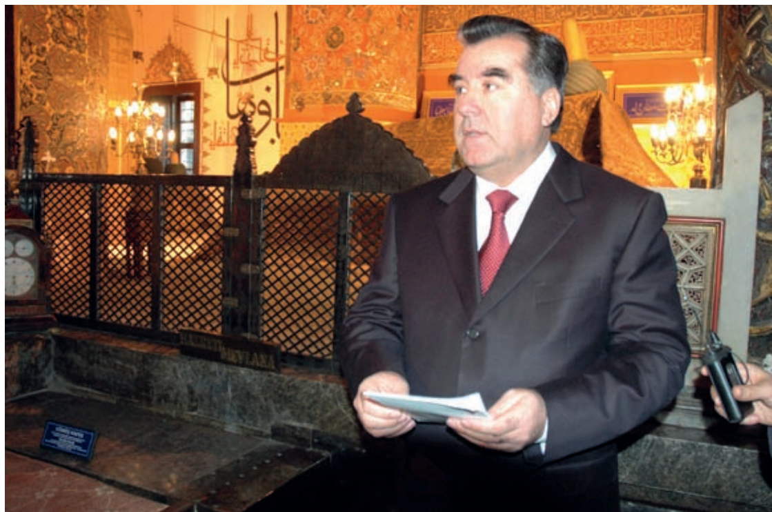
Speech of Emomali Rahmon at the sepulcher of Mevlana Jalaluddini Balkhi January 20, 2006, Konya