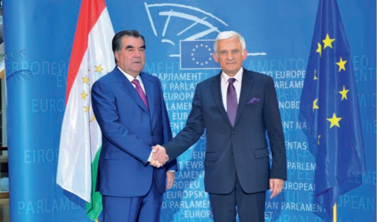
President of the Republic of Tajikistan Emomali Rahmon with the President of the European Parliament Jerzy Buzek June 6, 2011, Strasbourg