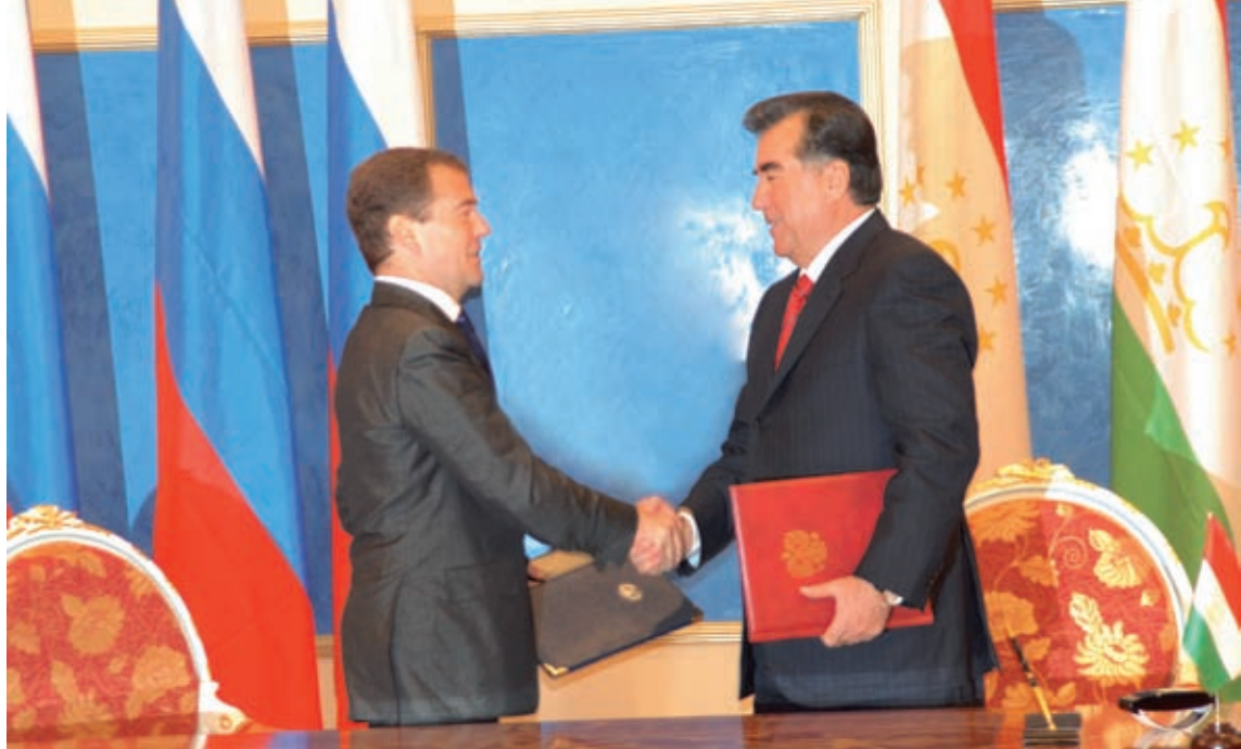
Emomali Rahmon with the President of the Russian Federation Dmitry Medvedev August 30, 2008, Dushanbe