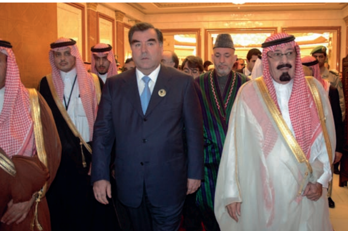
Emomali Rahmon with the King of Saudi Arabia Abdullah bin Abdul Aziz Al Saud December 7, 2005, Mecca