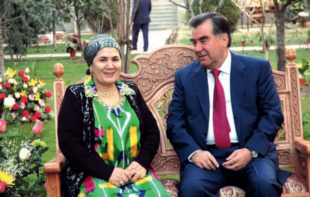
Emomali Rahmon with his spouse Azizmo