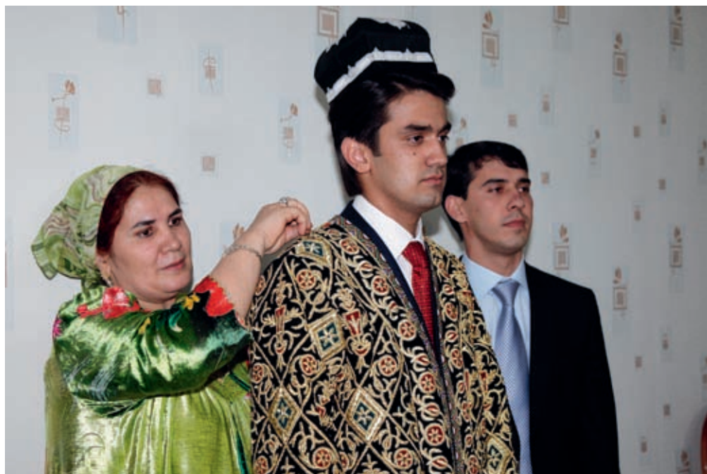
Emomali Rahmon's spouse at the wedding of her son Rustam