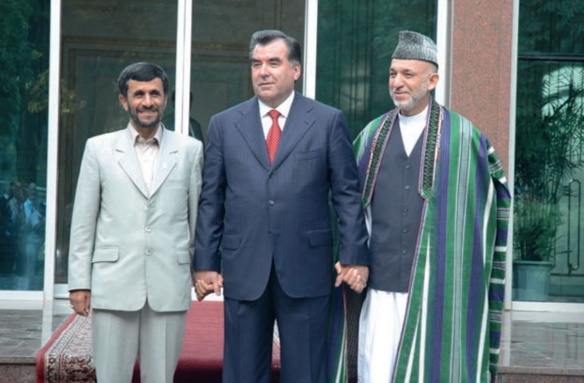
Trilateral meetings of the Presidents of Tajikistan, Afghanistan and Iran September 1, 2008, Dushanbe