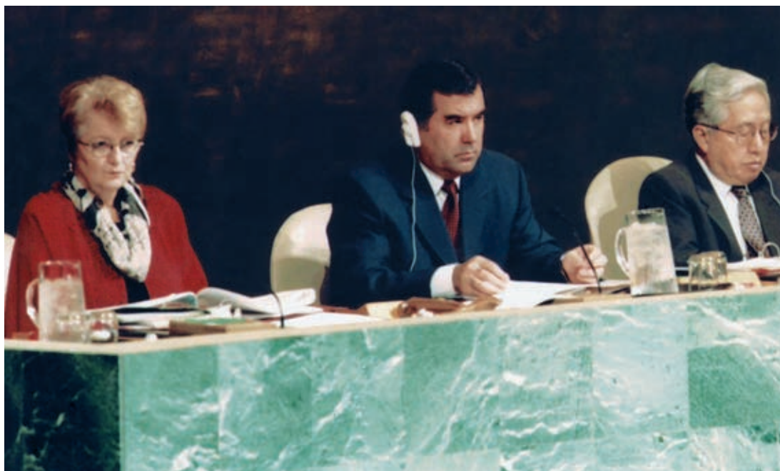
Emomali Rahmon presides at the United Nations General Assembly September 30, 1999, New York